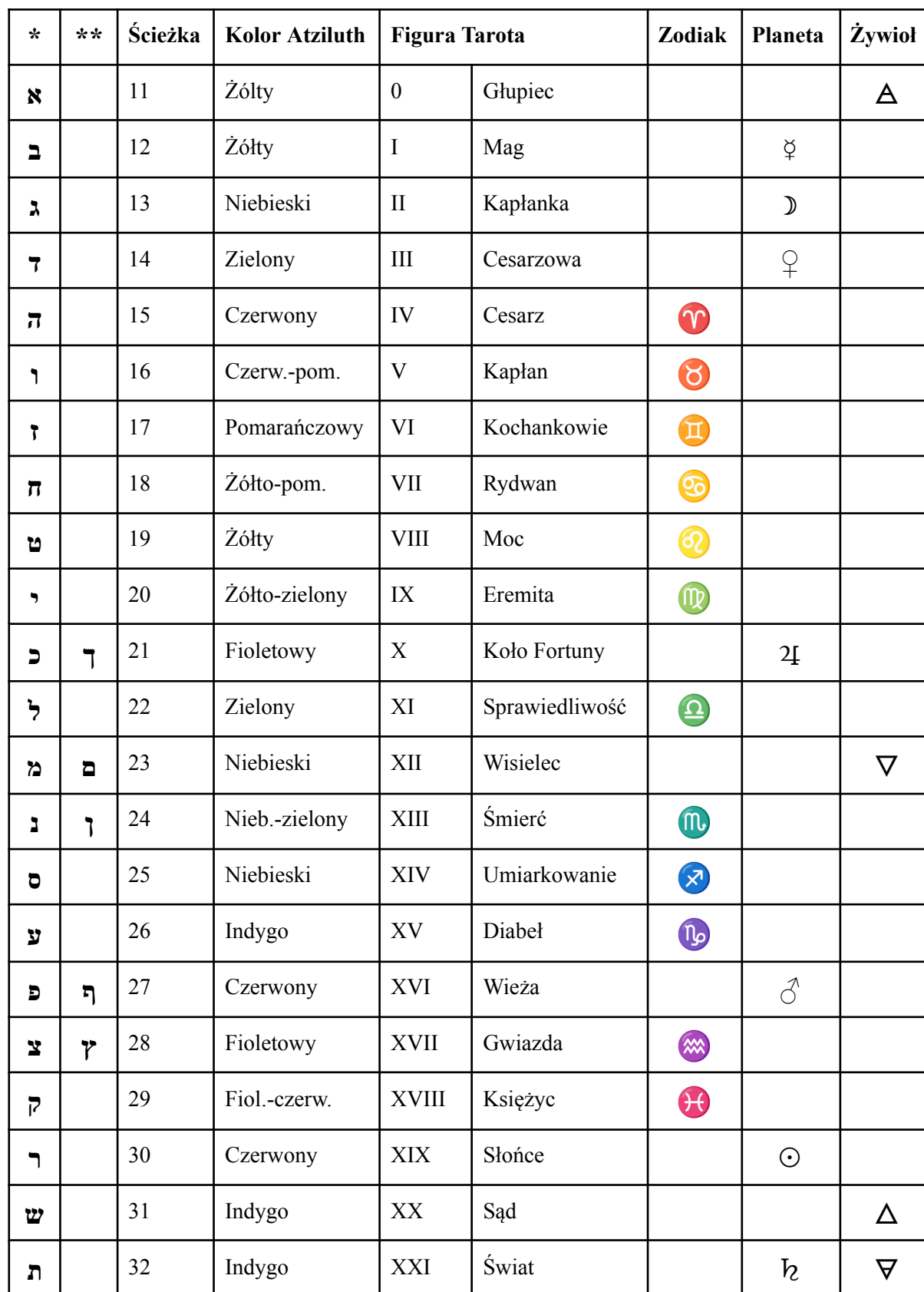
Tablica #137-B Tabela zgodności alfabetu hebrajskiego (c.d.)